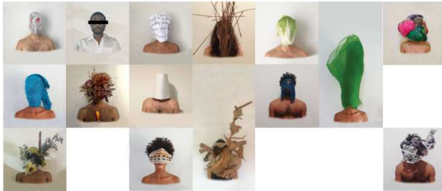
cabeças despedaçadas, em processo...

A pressão da tarefa: o rigor da frontalidade, o "apagamento" da cara, a máscara, a cabeça, o sonho, o surrealismo, a invenção com os materiais à sua volta, seu dadá, suas coisas, seu baú, o fundo da sua gaveta, sua memória, seu projeto encajado, sua raiva, sua vontade de ser outra coisa, de ser efeito, de ser magia, a mágica, o minimalismo que diz um montão, a síntese que revela o processo, uma peça, uma performance, uma escultura, suas escolhas, a foto 3x4 da identidade que a gente re/tira, mas que te revela ainda mais, porque eu te vejo por dentro e por fora.